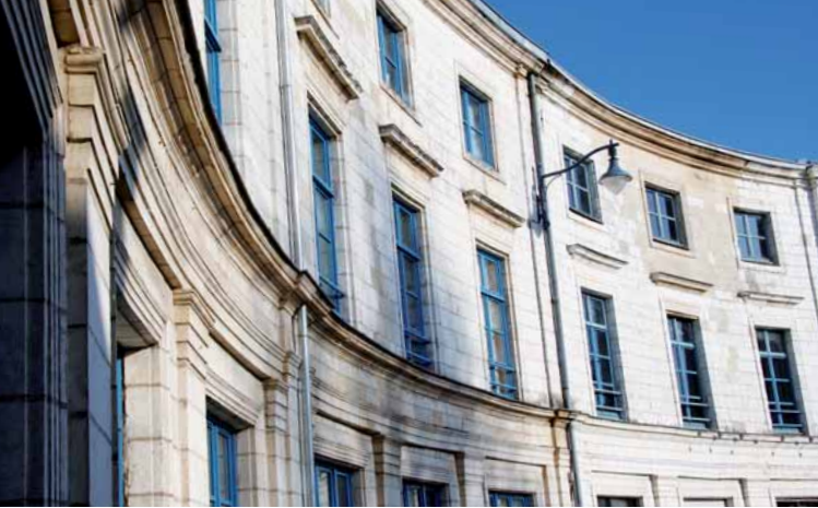
Place du 33 ème