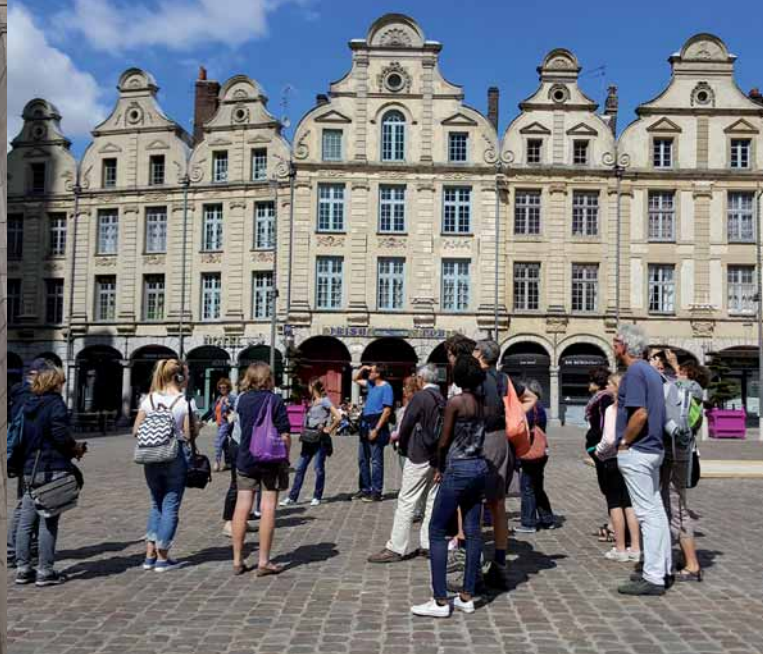
Place des Héros

2000 ans d'Histoire ont laissé à Arras de nombreux témoignages qui façonnent encore son exceptionnel patrimoine, dont 3 sites sont inscrits sur la Liste du patrimoine mondial de l'Unesco. Explorez la ville et remontez le temps. Des places au sommet du Beffroi, en passant par le Théâtre et la Cathédrale, nos visites guidées, à départs réguliers, incitent à l'évasion.