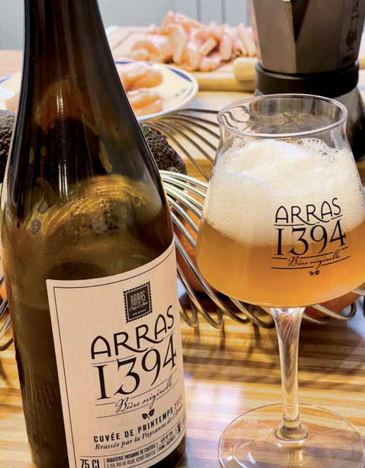
La cuvée annuelle de printemps Arras I394, © Denis Cordonnier