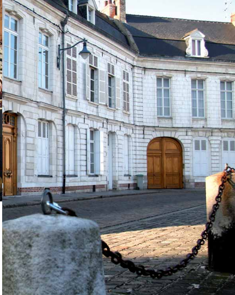
Place Victor-Hugo

Par Loraine Elsinga, guide-conférencière de l'Office de Tourisme d'Arras Pays d'Artois