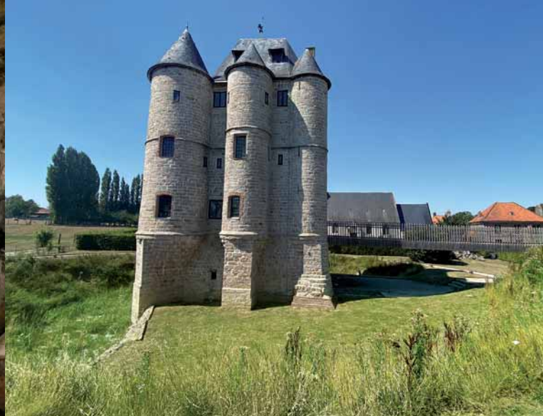
Le Donjon de Bours