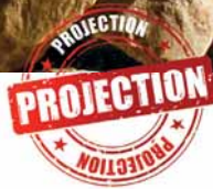
Arras 1917, L'histoire des tunneliers Néo-Zélandais

• Du 20 avril au 5 mai, le vendredi et le samedi à 18h30