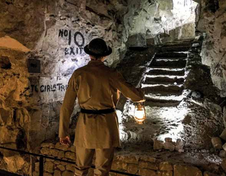
Track Game