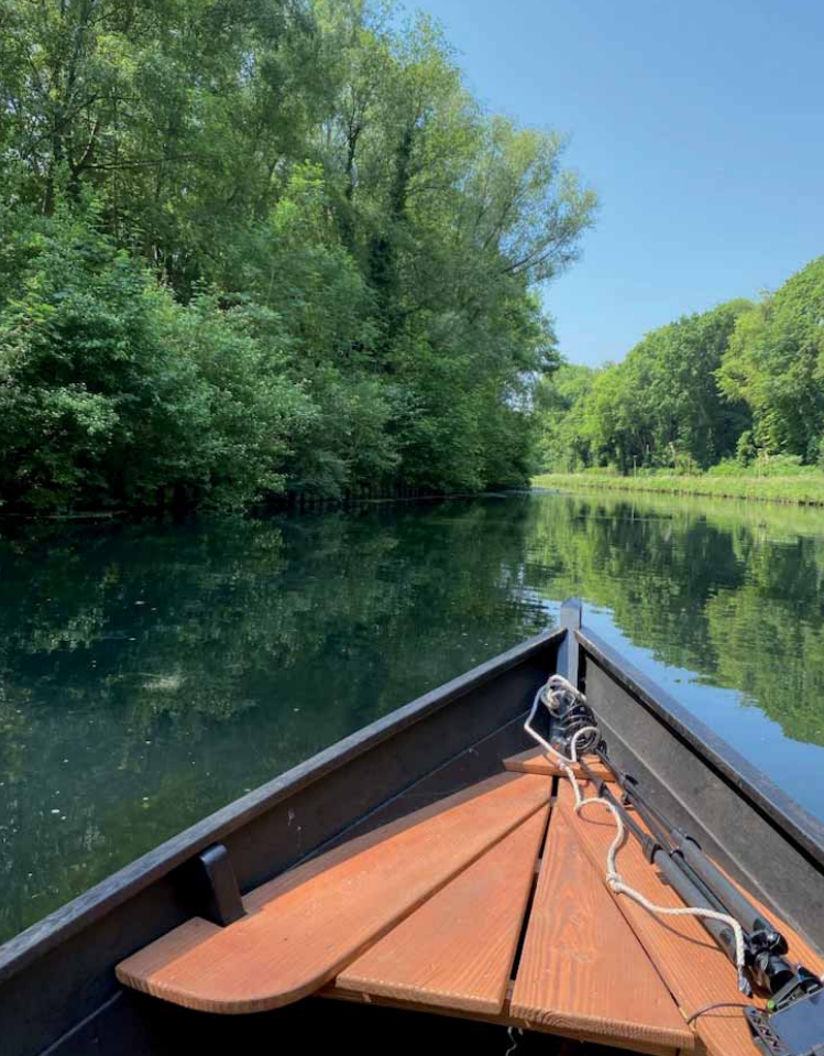
Balade en barque