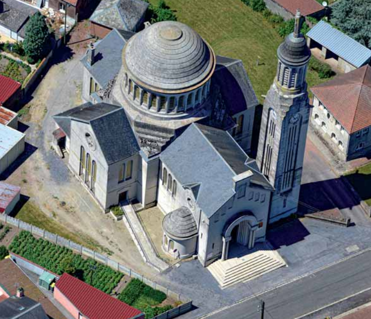
Église Notre-Dame d'Hermies