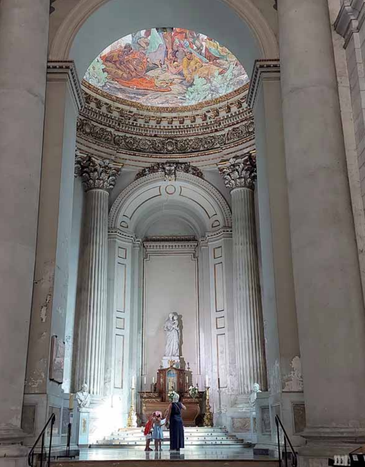
Cathédrale d'Arras