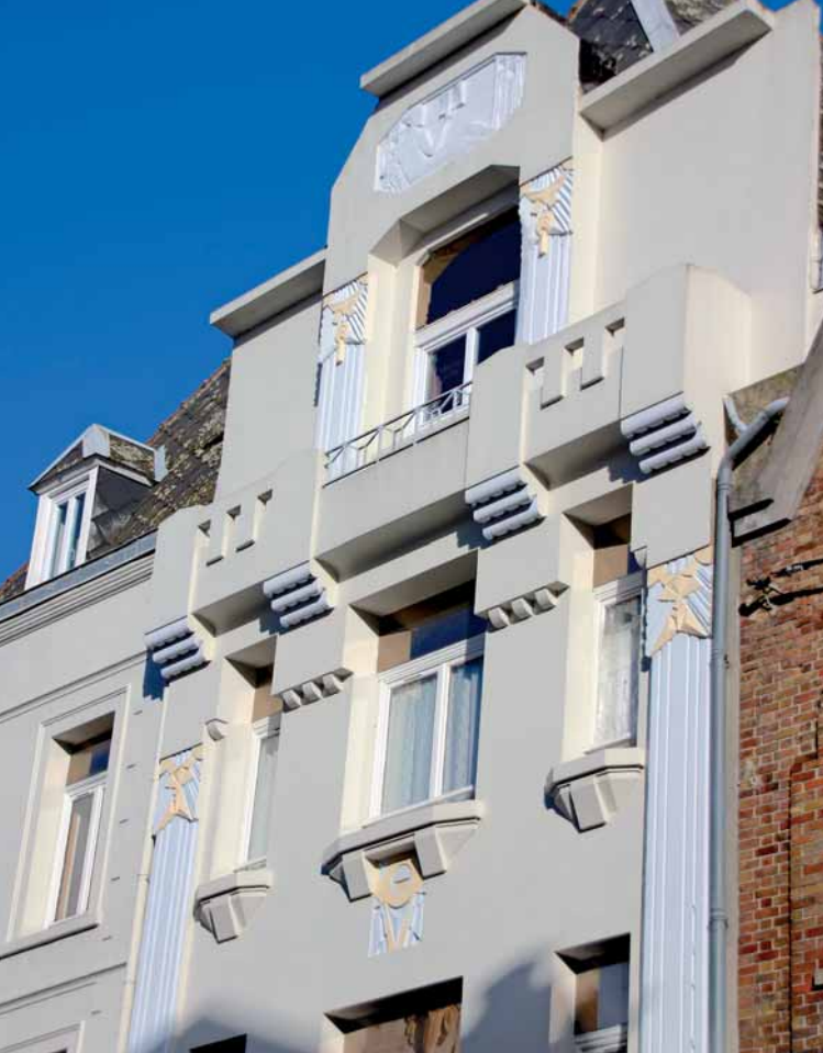
Façade Art déco rue Saint-Aubert à Arras