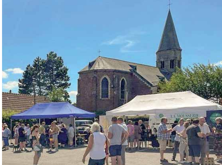
Bières en scène

Restauration sur place sur le site d'Ecoland