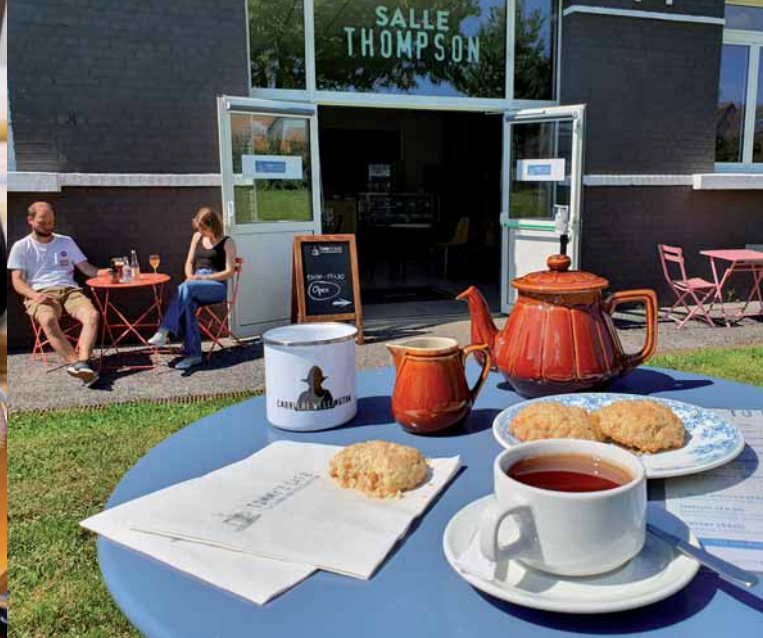
Tommy's Café

Avis à tous les gourmands, Arras Pays d'Artois Tourisme vous initie aux délicieuses saveurs locales à travers de nombreuses activités culinaires. Découvrez « sous les pavés, la bière » au cœur des Boves et dégustez des bières locales accordées avec les meilleurs fromages, émerveillez vos papilles au sein de nos meilleurs restaurants, profitez de l'esprit de fête arrageois aux côtés de nos plus grands spécialistes de la bière au cours du Beer Potes Festival.