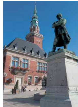
Place Faidherbe à Bapaume

De la bataille de Bapaume de 1871 à la Seconde Guerre mondiale, revivez l'histoire de Bapaume à travers ses places et les grands noms qui y ont participé.