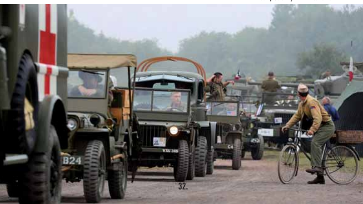
Camp US army

Petite restauration et buvette sur place, le midi et le soir