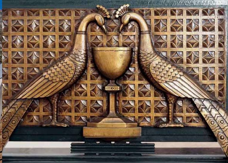
Détails du maître-autel de la Cathédrale d'Arras

Il y a un siècle débutait la Grande Reconstruction du Pays d'Artois. Les villes et villages dévastés ont su se relever avec élégance : les édifices recréés à l'identique côtoient de nombreuses réalisations spectaculaires, d'avant-garde ou fantaisistes, laissant libre cours à l'expression du style Art déco. Ce printemps, nous vous emmenons, de rendez-vous insolites en visites inédites, à la découverte de chefs-d'œuvres d'architecture, témoins élégants de la reconstruction du territoire après la Grande Guerre. Levez les yeux et suivez le guide.