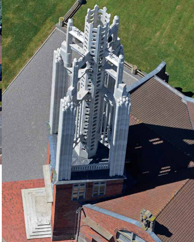
Vue du clocher de l'église de Rocquigny