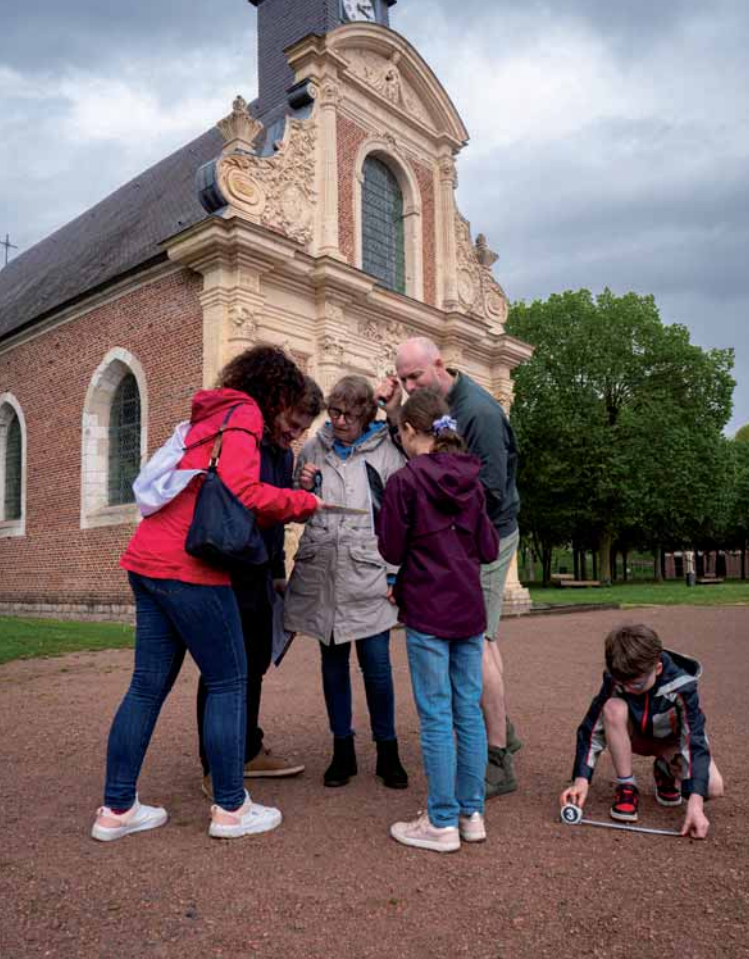
L'énigme de la Citadelle