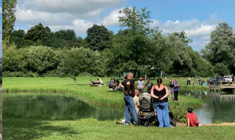
Pisciculture de Monchel-sur-Canche