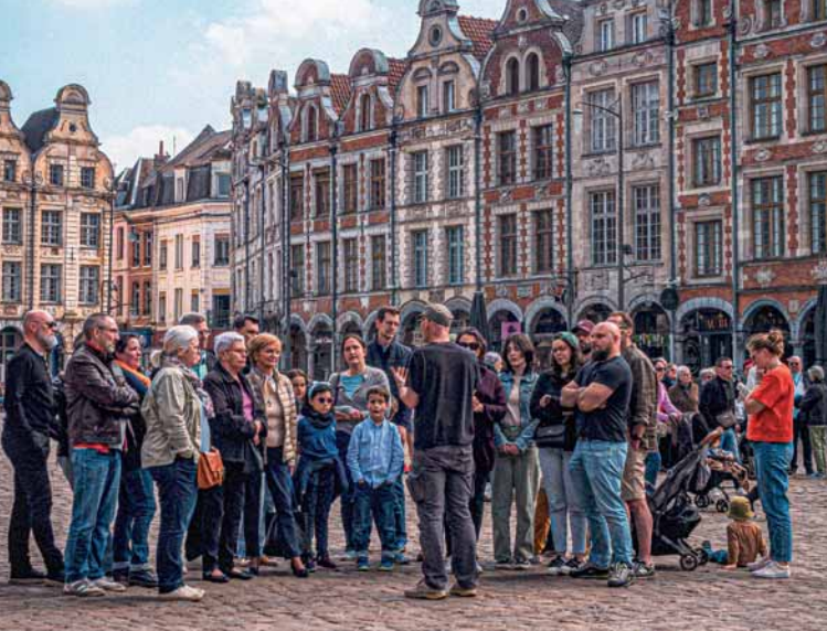
Place des Héros