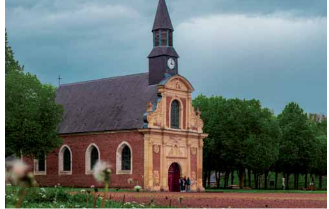
La Chapelle de la Citadelle

* Sous réserve de disponibilité des salles