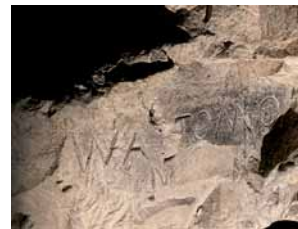
Graffiti Discovery

Visitez la Carrière Wellington et découvrez les témoignages gravés dans la craie par ses occupants au fil des siècles.