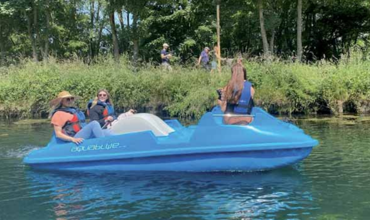
Pédalo sur la Scarpe